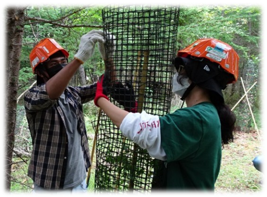
獣害対策防止ネット補修の様子