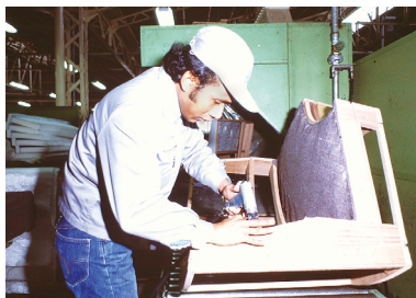
委託研修では、日本の最先端技術だけでなく、職場の改善・効率化のための5S(整理・整頓・清掃・清潔・しつけ)やチームワークなども学んだ(写真は1980年頃)