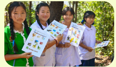
学生同士が主体となって挑む！ 環境教育プログラムの企画・実践