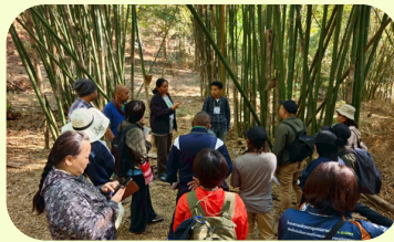
プロジェクトサイトの視察