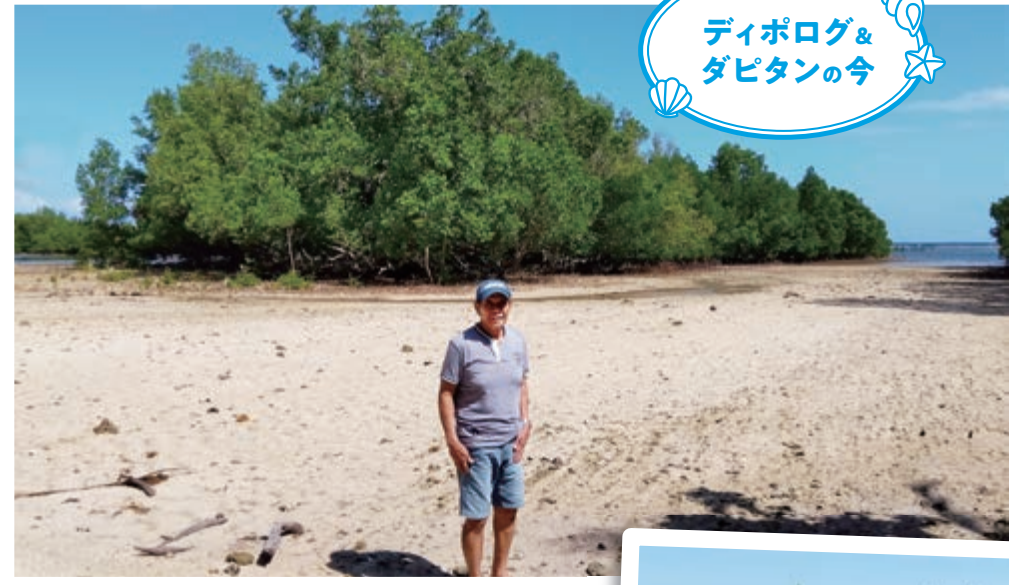
ダピタンのマングローブ植林を担当してきたOB/ノンさん。バイリマゴにも立派な森が育っている