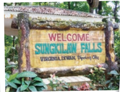
多くの観光客が訪れるスンキラオの滝