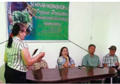
左／実現した有機農業セミナー(2月17日)