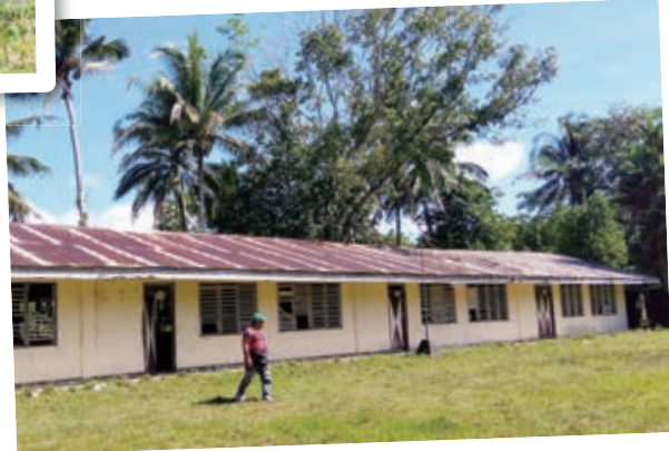
ピニアン研修センターも建物はあるものの、研修は行われていない。敷地の一部はフィリピンコナツ庁が育苗などに活用している