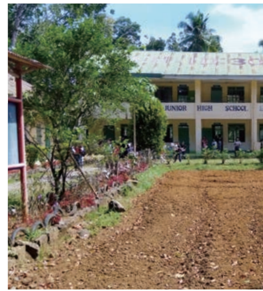
バマンサランエコテックハイスクール。トラクターなども配備された実習農場