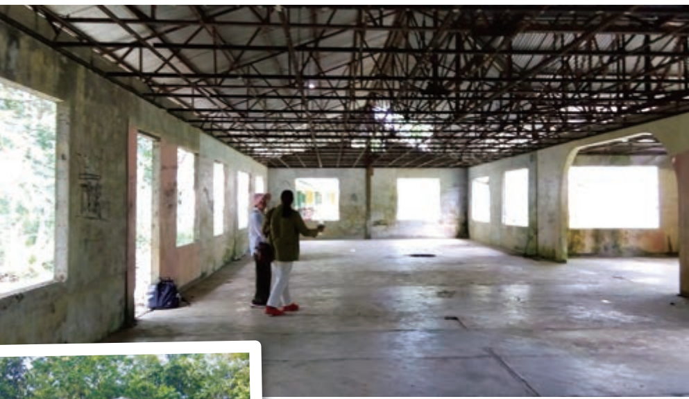
ディポログ市に移管したものの現在は使われていないバマンサラン研修センターの建物。建物前にあるフィリピンイーグルは今も残っている(本誌12ページ参照)。