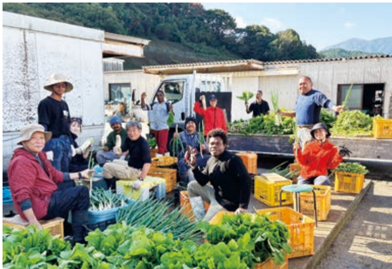
西日本研修センターの出荷準備の様子。後列右端が本人