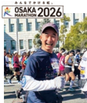
笑顔で走り切りました！

が、今年は日中の気温が20℃を超え、2月とは思えないほどの暑さに。朝のスタート時との気温差もあり、ランナーのコンディションへの影響も心配されましたが、ベストを尽くして懸命に走る姿に、沿道の応援にも熱が入りました。 寄附金は大会事務局によってとりまとめられ「海岸林再生プロジェクト」への支援となります。チャリティランナーをはじめ、寄附や現地での声援で応援してくださいました皆さま、ありがとうございました！