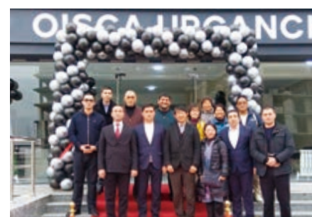
日本人参加者からは「3年後の変化を見てみたい」など、開発が進んだその後の街の姿に関心を寄せる声が聞かれた

発会式には同市の経済・投資担当副市長も参加し、ウルゲンチ支局会長と共に支局事務所のテープカットを行いました。事務所は開発が進むエリアにあり、周辺では大規模な建設工事が行われています。その中には日本の投資が進むホテルや商業施設などが入る複合ビル「ジャパンプラザ」