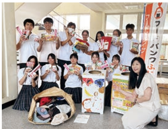
フードドライブの活動。中央の食品を入れる箱は生徒の手作り!

て、オープンスクールにも行きまし た。今は英検2級の合格を目指して 勉強しています。