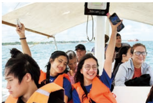
ネグロス島のサガイからカービンリーフまで船で移動！とても楽しい時間でした

私が所属するインターアクト部では、地元浜松のロータリークラブと協力して、天竜浜名湖鉄道線の駅の環境整備として行う「花のリレー・プロジェクト」や東日本大震災関連では「チャリティキャンドル」などを一緒に進めています。