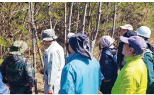
トークイベント翌日には現場で松くい虫被害の勉強会が行われた

3月13日、「緑の国際協力で進める森づくり・人づくり・地域づくり」(国土緑化推進機構、国際緑化推進センター共催)をテーマとするシンポジウムが東京都内で開催されました。これは緑の募金法制定30周年を記念したもので、これにより募金の国際協力事業への活用が可能となったことから、緑の募金の支援が進む海外の事例発表が行われました。オイスカからはインドネシアの事例を紹介。学校とその周辺で行う緑化や水保全のための施設整備など、「子供の森」計画をベースにして事業を展開し、子どもたちを主体にその効果を地域に波及させ