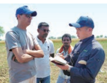
協力農家(中央2名)の聞き取り。竹炭を用いたエリアでは小麦の丈が高く育ち、土壌や作物への効果が確認された(写真はチャドフル村)

する聞き取り調査を中心に行いました。なお、今年5月下旬には地元農家を中心とした訪日研修を予定しており、去る3月25日に開催した事前セミナーでは質問や意見が飛び交うなど、参加者からの強い意欲が感じられました。