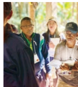
住民リーダーより、竹の活用方法について話を聞く

研修では、各国の活動報告に加え、森の再生が地域の暮らしを支えている現場を視察。養蜂や竹細工、山菜栽培など、住民が主体的に森林資源を活用し、収益につなげている事例から、地域の人々が連携して、いきいきと環境保全と暮らしを両立させている仕組みを学び、自国で応用するヒントを得ました。また、五感を使って自然への理解を深める