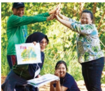
インドネシアのコーディネーターから共有されたネイチャーゲーム（木こりとリス）

2月12〜17日、タイ北部のチェンライ県で「子供の森」計画（以下、CFP）の国際コーディネーター研修を開催。タイを含む、アジア・太平洋地域の8カ国から20名が集まり、コーディネーターの環境教育のスキル向上とネットワーク強化を図りました。