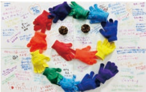
EXPOで掲示したボードには、チャリティランナーの意気込みと応援メッセージがたくさん！