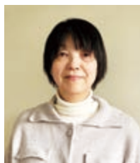
オイスカ浜松 国際高等学校