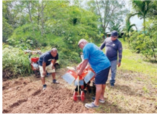
現在も農業に関わる仕事をしています！