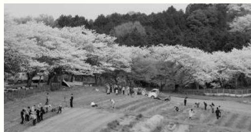
オイスカ研修農場遠景

ビジネスマナーや挨拶・5Sに加え、オイスカ独自のプログラムを全日程を通じて盛り込んでおり、自然に囲まれた当研修センターに宿泊しながら、アジア・太平洋地域から来た研修生と共に過ごす時間も貴重な体験になります。