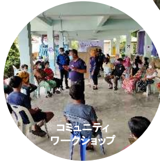
コミュニティワークショップ

A: オイスカは地域住民と各行政機関や民間団体を繋ぎ、ネットワークを広げることで人々の潜在能力を引出し、住民主体の地域振興をサポートします。