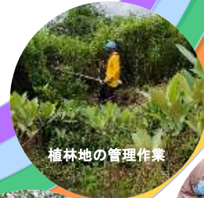
植林地の管理作業