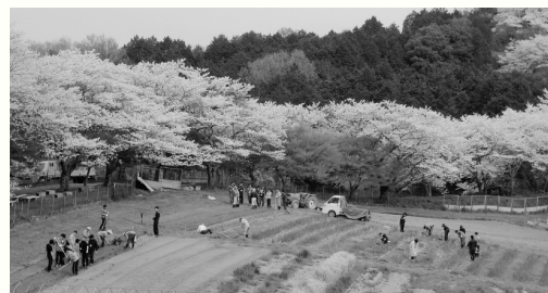
オイスカ研修農場遠景

ビジネスマナーや挨拶・5Sに加え、オイスカ独自のプログラムを全日程を通じて盛り込んでおり、自然に囲まれた当研修センターに宿泊しながら、アジア・太平洋地域から来た研修生と共に過ごす時間も貴重な体験になります。