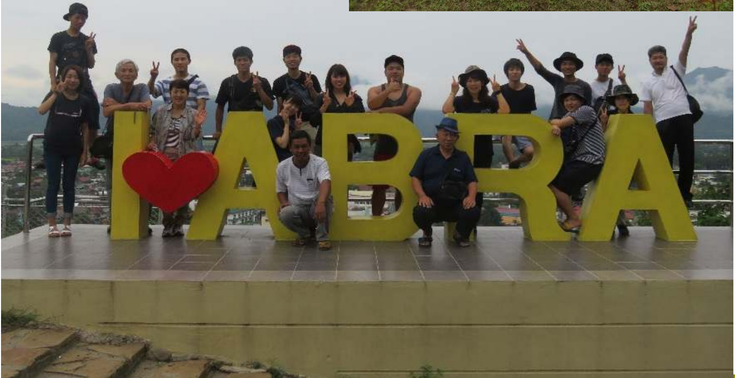
(写真はイメージです) 2017年度ツアー中写真より