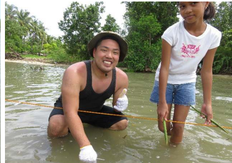
(写真はイメージです)2017年度ツアー中写真より