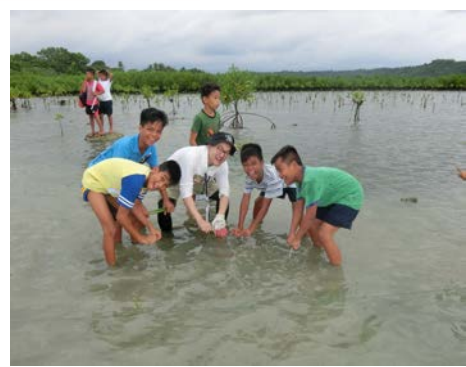
(写真はイメージです)2016年度ツアー中写真より