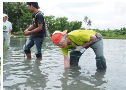
(写真はイメージです)2013年度のツアー中写真より