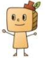
「森のつみ木広場」 イメージキャラクター つみっく

将来を担う子どもたちへの環境教育プログラムを楽しみながら学びましょう。 どちらか一日だけのお申込みも可能です。 ご参加、お待ちしております。