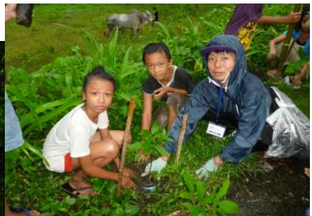
(写真はイメージです)2012年度のツアー中写真より