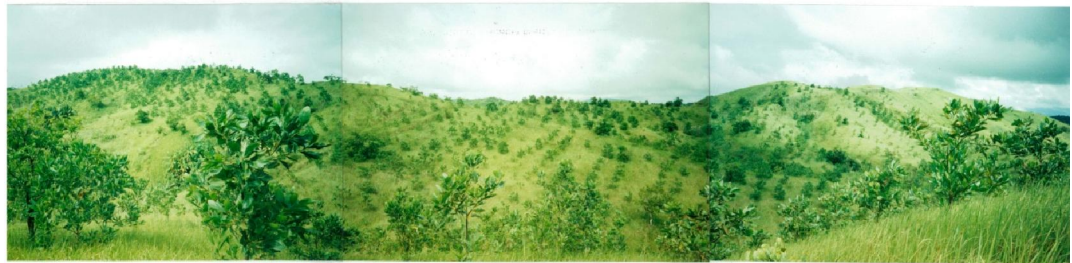
The 1- year and 6-month old Acacia Manguim ( Photo taken April, 2002 )