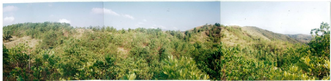
The 4- year and 5-month old Acacia Manguim ( Photo taken March, 2005 )