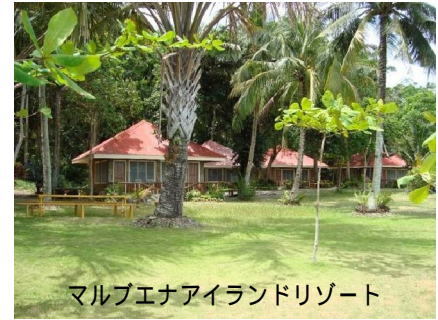
マルブエナアイランドリゾート

フィリピンは 7109 の島からなる島諸国。首都マニラ 面積 29.9 万 \text{km}^2 (日本の約 8 割の大きさ) 人口 9200 万人(推計) 公用語：タガログ語、英語、各地域に方言がある 成田 マニラ約 4 時間 30 分 マニラ イロイロ約 1 時間 マニラの平均気温 26.7 (東京の平均気温 16.1 ) 日本との時差 1 時間 (日本が 9 時なら、フィリピンは 8 時)