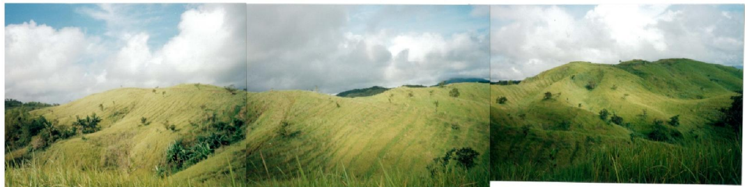
Part of 47 hectares after planting ( Photo Taken October, 2000 )