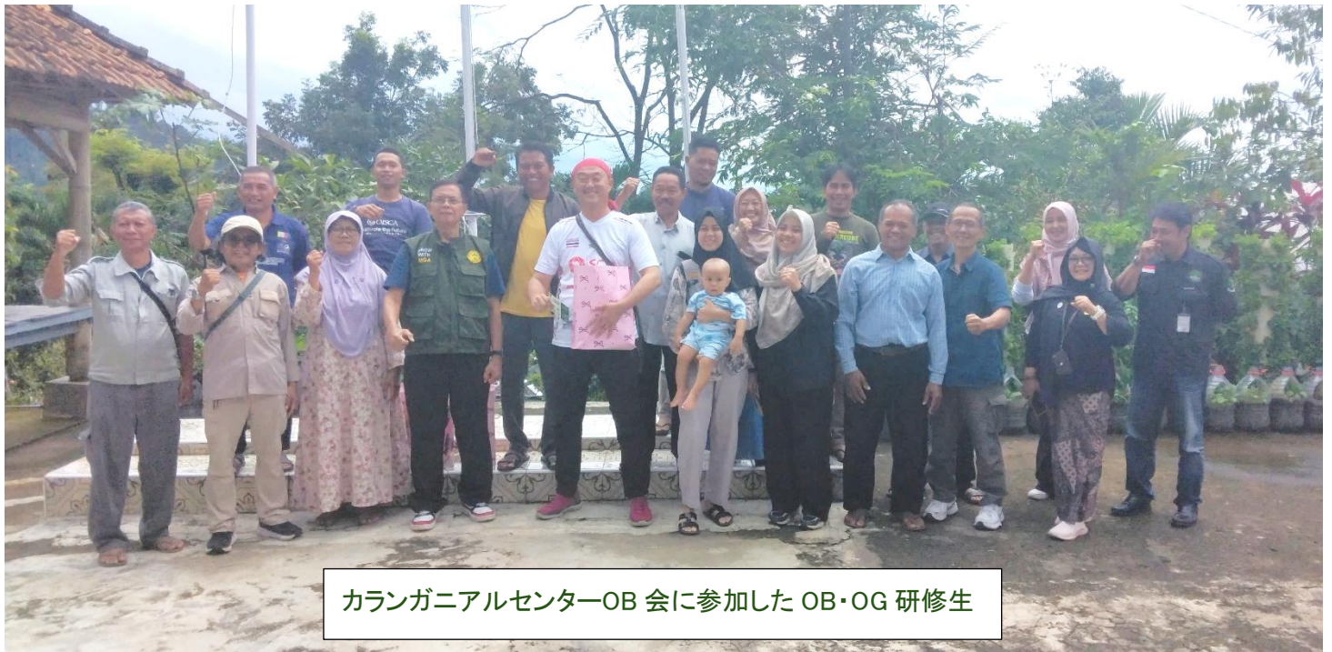
カラニアルセンターOB 会に参加した OB・OG 研修生