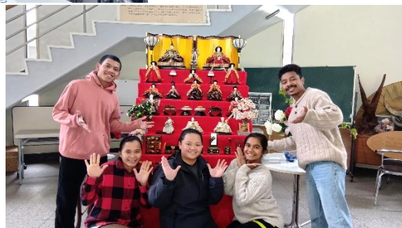
Aクラス ひなまつり