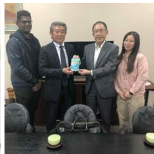
トヨタモビリティパーツ 九州北部統括支社にて贈呈式