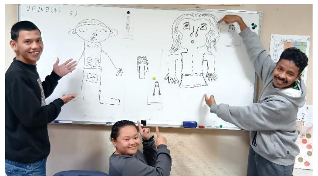
Aクラス 見た絵を日本語で 伝えてもらって、描いた絵