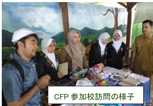
CFP 参加校訪問の様子

様々なプロジェクトの現在の状況を視察させていただき、オイスカインドネシアのスタッフの今日までの献身的な対応、各コミュニティとの積極的な関りなどを拝見し、ここでもオイスカの OB・OG スタッフのレベルの高さと気持ちの強さに感心しました。