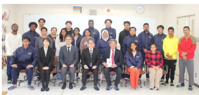
九州電力より贈呈式 於:西日本研修センター