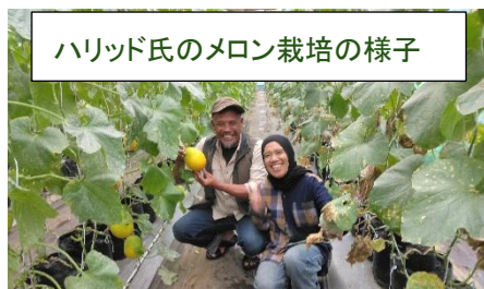
ハリッド氏のメロン栽培の様子

また、OB の活動現場の視察では、キノコ栽培やメロン栽培を手広く運営している OB もいて、農業技術のレベルの高さに驚かされました。