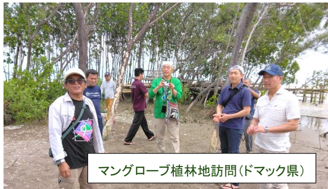
マングローブ植林地訪問(ドマック県)