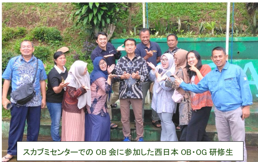
スカブミセンターでの OB 会に参加した西日本 OB・OG 研修生

1月9日(金)～17日(土)にかけての1週間、インドネシアジャワ島、特に研修センターのある西ジャワ州そして、カラングニアル研修センターのある中部ジャワ州を中心に、訪日 OB・OG 研修生の追跡調査を行ってきました。9日に羽田空港を出発し、ジャカルタに到着後スカブミセンターに移動しました。10日～12日までの3日間では、スカブミセンターに OB・OG 研修生が40名近く集まっていたいただき、活動報告などをしていただきました。