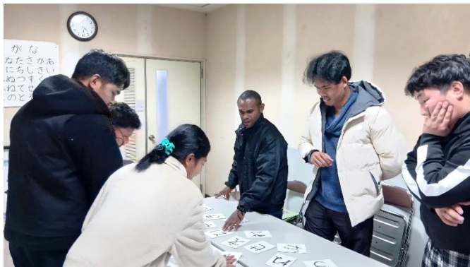
Bクラス かるたとり