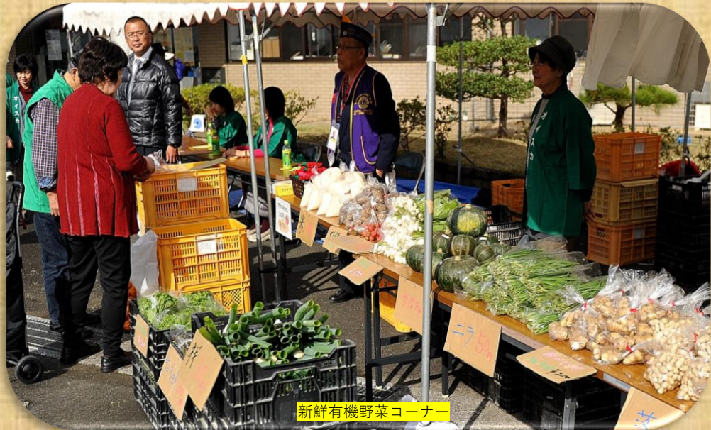
新鮮有機野菜コーナー