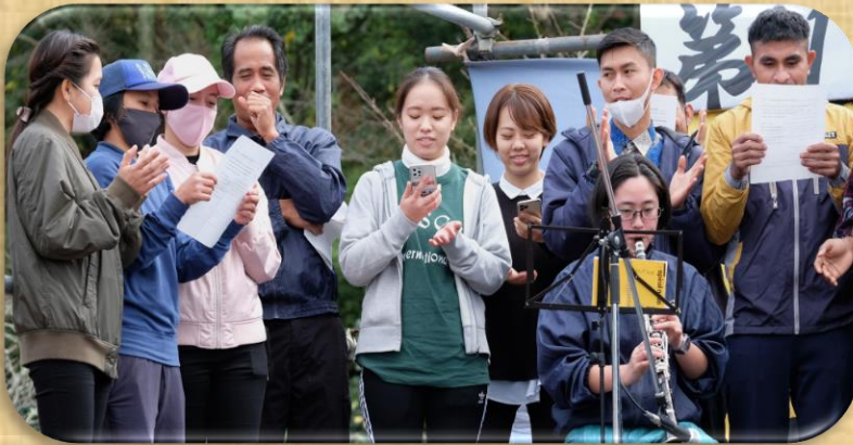
海外研修生の演奏