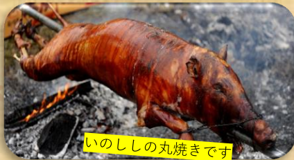
いのししの丸焼きです

今年も秋の収穫祭イベントが開催されます。旬の味覚や採れたて農産物をたくさん揃え、各種ブースでの販売や賑やかなイベント満載で、お楽しみ大抽選会ではたくさんの賞品を揃えています。また今年度は7ヶ国より7名の海外研修生が入所しています。みなさまのご来場お待ちしております！