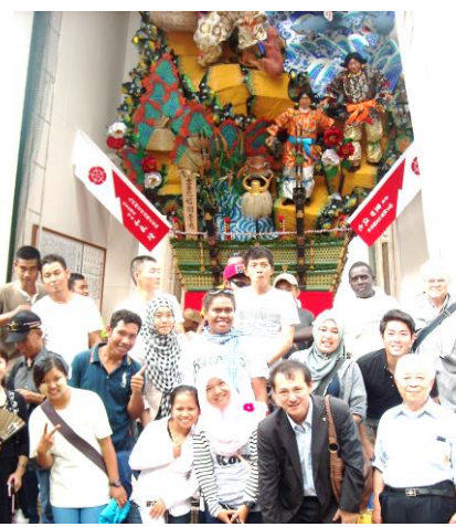
↑ ライオンズクラブの皆様と