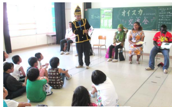
↑ 母国の紹介中(マイク)

7月7日早良小学校に研修生の半分のメンバーがお邪魔し、3年生のみなさんと交流しました。早良小学校での交流会は年間を通して数回行う予定で、初めての今回は研修生が母国の紹介をし、いろいろな国のことを知ってもらいました。母国の紹介後にはグループに分かれフリートークを行い、更に親交を深めることができました。小学生のみなさんからもたくさん質問があり、有意義な時間が過ごせました。また2学期に2回目の交流会を行う予定です。もっとたくさん交流できるようにそれまでに日本語の勉強頑張りませう！(榮)