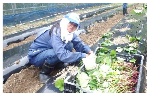
↑ サツマイモ定植中の マー

オイスカ農園の野菜も、梅雨時期の長雨、豪雨の被害から抜けた後のカンカン照りという事で、根傷みをおこしてかなり疲れている様子です。特に今年のトマトはハウス、露地共に不作で、様々な病気の被害を受けて収穫は例年の半分にも届かない状況です。それでもオイスカ研修生は、毎日農業実習に一生懸命取り組んでおり、その甲斐あってキュウリやナスなどを中心に毎日多くの野菜を収穫しています。これから暑くて食欲がわかない方が増える時期でもありますが、ゴーヤやオクラ、モロヘイヤなどのトロトロ野菜をたくさん食べて「今日も一日頑張りましょう」。(豊田)