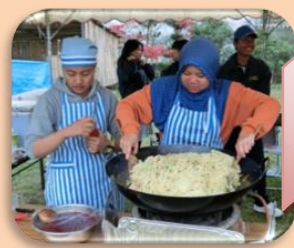
アジアフード & 屋台村