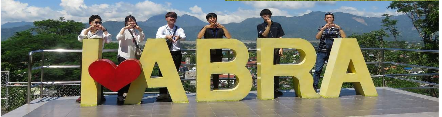
(写真はイメージです)2023年度ツアー中写真より