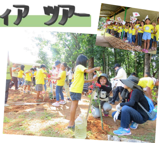
(写真はイメージです)2023年度ツアー中写真より