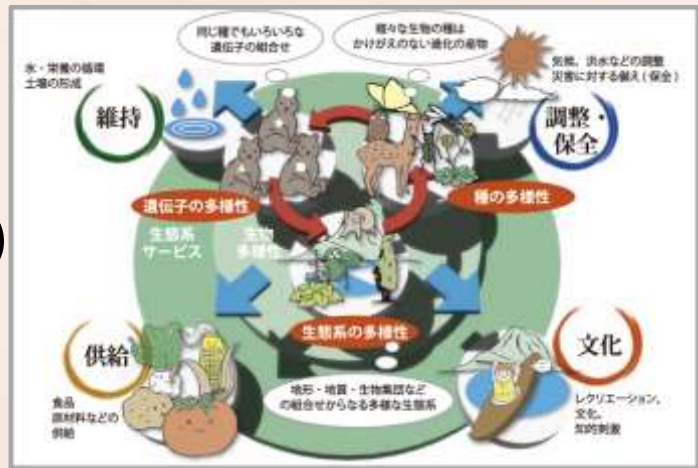
北海道生物多様性ポータルサイトから引用