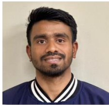
ラキブ (バングラデシュ)