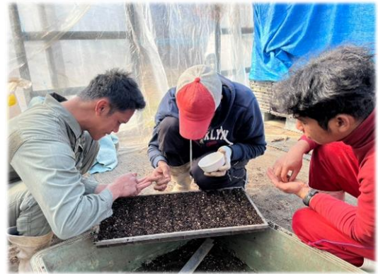
今年のトマトを播種