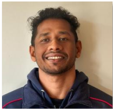
サミタ (スリランカ)