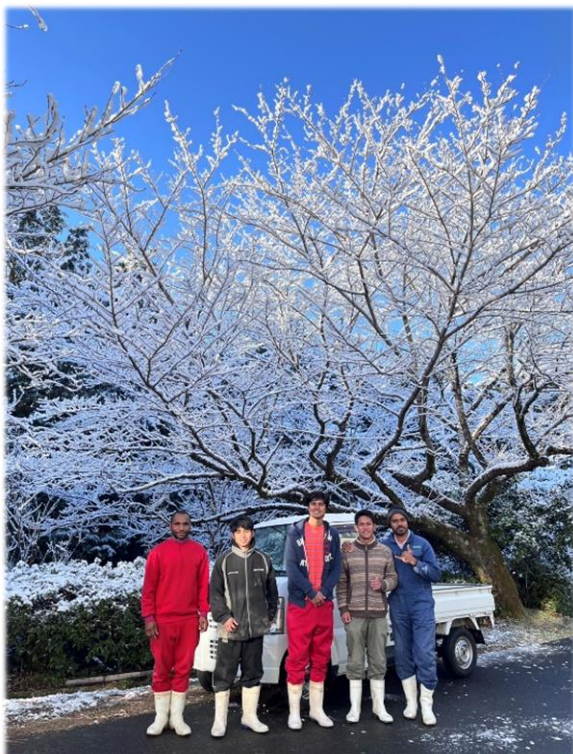
初めて雪を見ました！みんな大喜び！