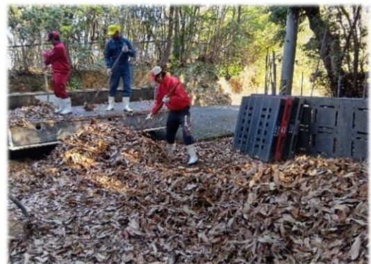
堆肥を作るための落ち葉集め