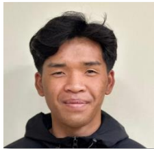
ヨエル (マレーシア)