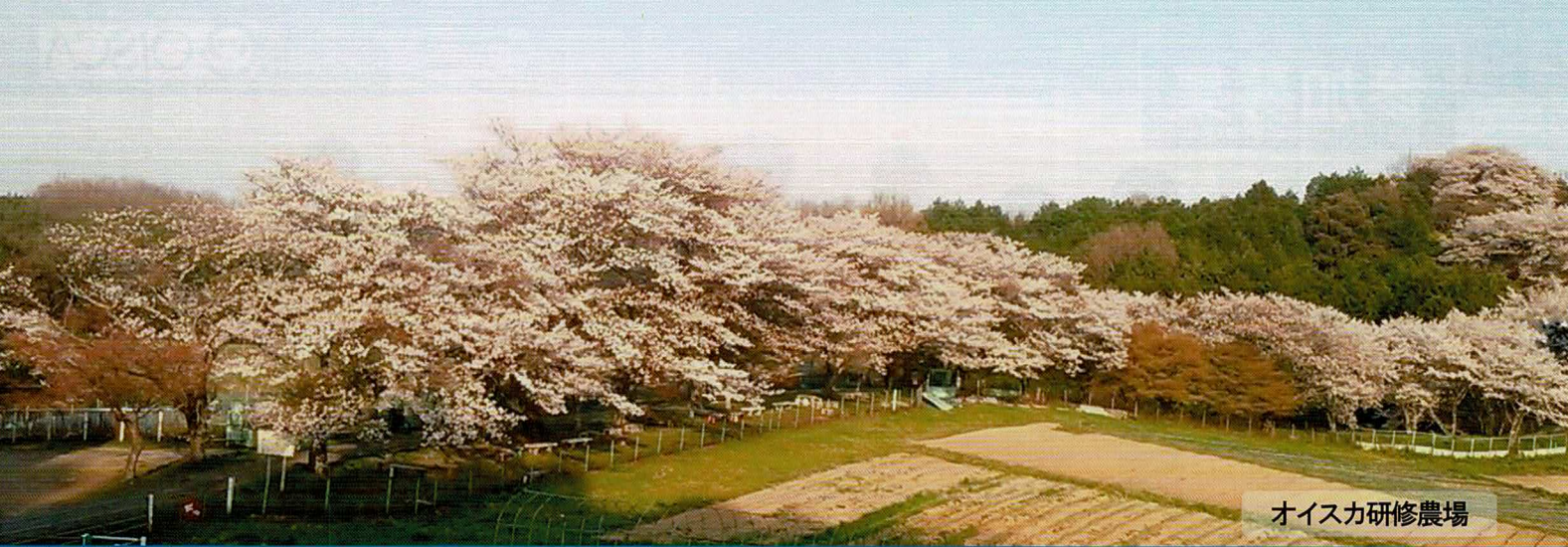
オイスカ研修農場