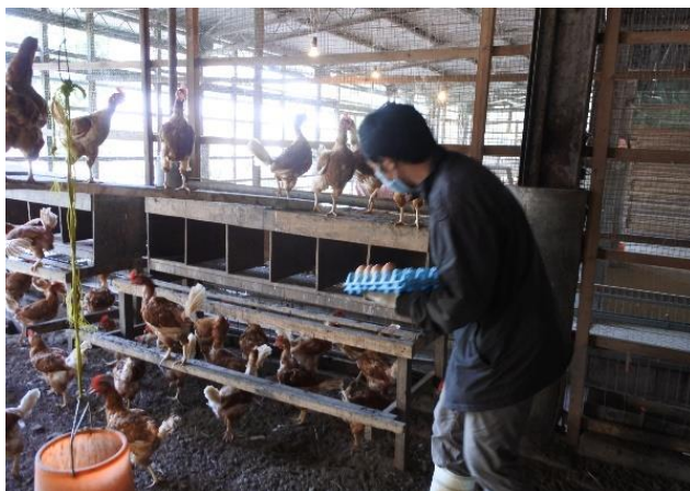
平飼いで育てています

新鮮な野菜やおからを食べて、元気いっぱい動きまわるのニワトリたちの卵は、おいしいのはもちろん、栄養もたっぷりです！