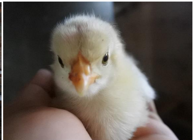
ひよこの時からセンターで育てています